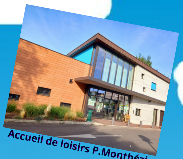
Accueil de loisirs P. Monthézin

L'équipe d'animation est à votre disposition et votre écoute. N'hésitez pas à les questionner sur la journée de votre enfant.