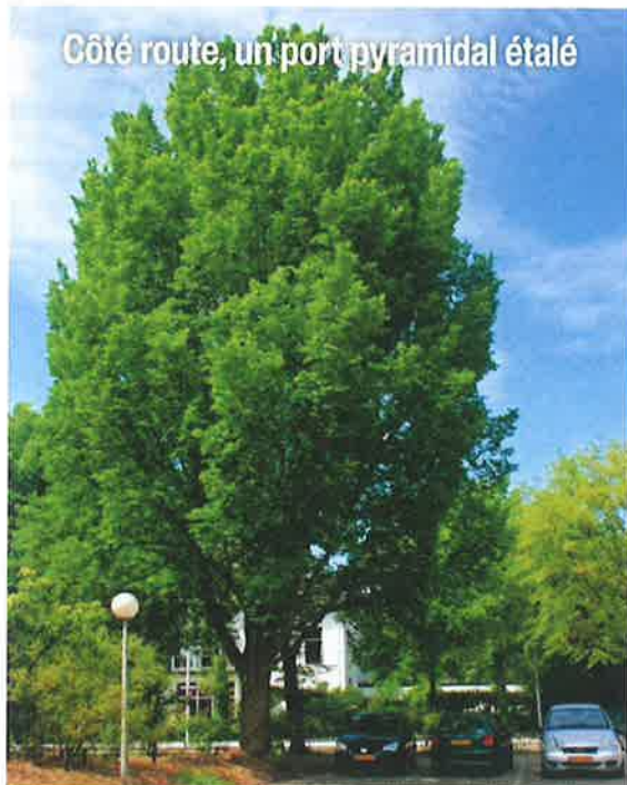
Côté route, un port pyramidal étalé