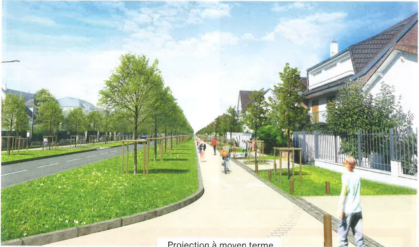
Projection à moyen terme

L'avenue du Général de Gaulle d'ici quelques années