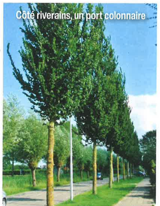
Côté riverains, un port colonnaire

350 ormes en port libre (forme naturelle)