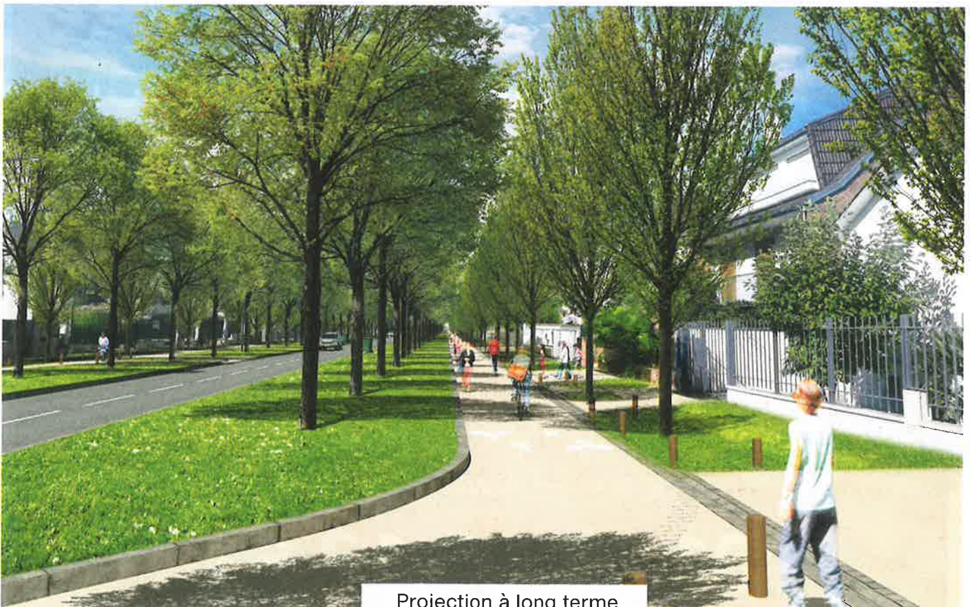
Projection à long terme